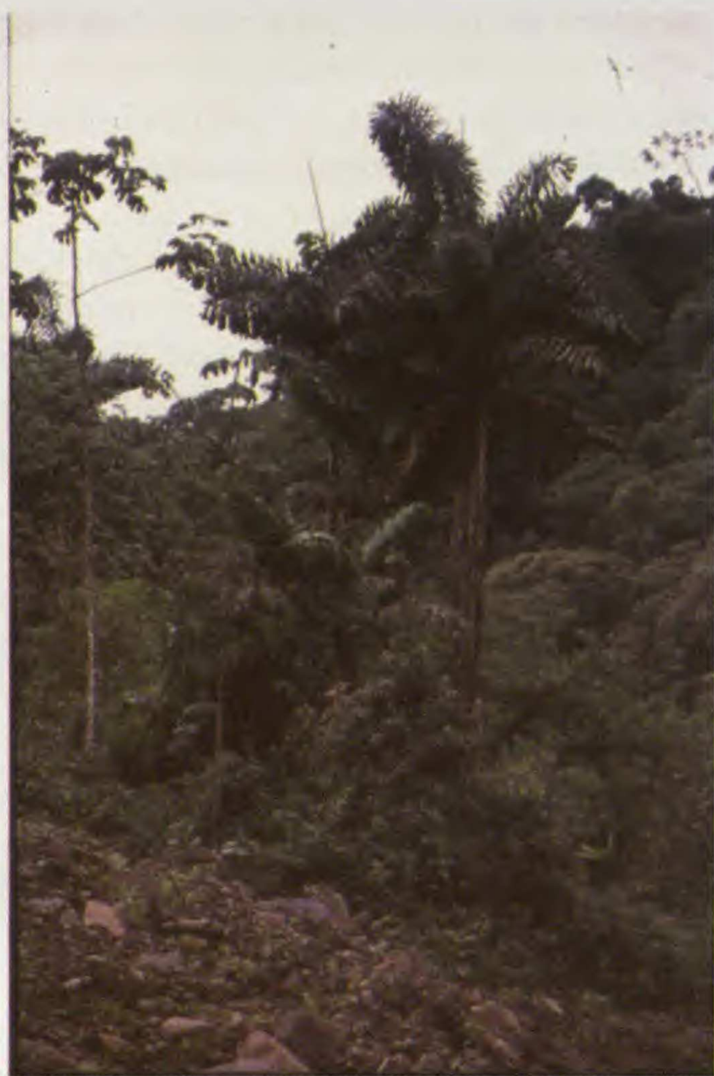
Fig. 3. La palmera arbórea Dictyocaryum lamarckianum en los bosques andinos del departamento de Cochabamba.